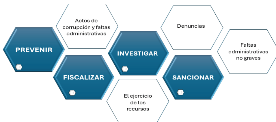
Figura 1. Funciones del OIC.

Luego entonces, con el objeto de dar a conocer el avance del programa de trabajo del OIC 2024, se tiene a bien integrar el presente documento que consta de un Informe Ejecutivo que proporciona información cuantitativa sobre las actividades y resultados alcanzados al mes de junio del año en curso y, un Informe Detallado que contiene datos pormenorizados sobre cada tema. En ambos informes, conforme a lo descrito en la Figura 1, se agrupa la información en cuatro grandes funciones: